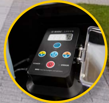
Energieeffiziente, drehzahlgeregelte Filterumwälzpumpe