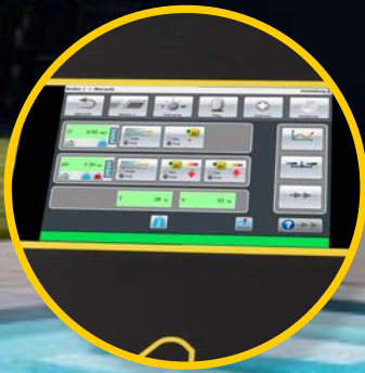
Touchscreen zur Steuerung aller Parameter und Attraktionen